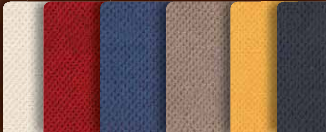
BEECH HIGH GLOSS – INTERIOR WOOD OPTION

Hai l'imbarazzo della scelta tra legno di ciliegio, mogano o Beech High Gloss oppure l'elegante pelle. Ci sono moltovarianti per personalizzare gli interni. Insieme al nostro concetto di cabina, ci sono possibilità mai viste prima.